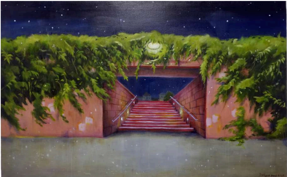
Sohyun Park , Une nuit d'été à Lyon II , Huile sur toile, 2023.