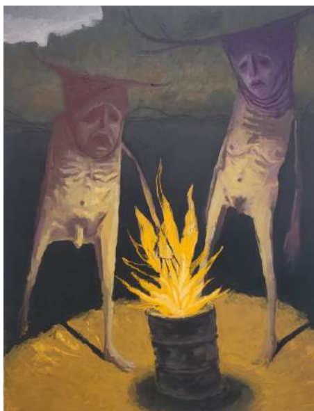
Suan Muller , Le ciel est fermé , Huile sur toile, 2023.