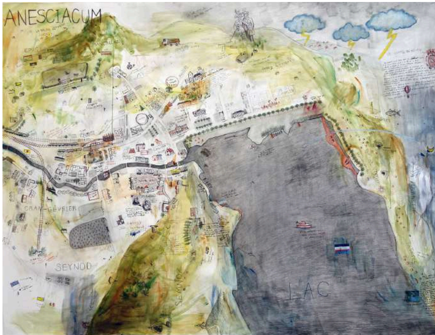
Sohyun Park , Anesciacum , Acrylique, encre de Chine, pastel à l'huile sur papier, 2018.