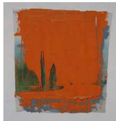
Kacem NOUA Sans titre , 2007 Acrylique sur contreplaqué marine, 153 x 159 Collection de l'artiste

Kacem Noua propose la réalité inventée d'une peinture mise en scène dans son fonctionnement ornemental et décoratif. L'œuvre exposée sur le mur est disposée avec cette frontalité qui trouble l'œil dupé et perturbé par l'illusion de formes organiques totalement inventées et modelées par les contrastes de couleur.